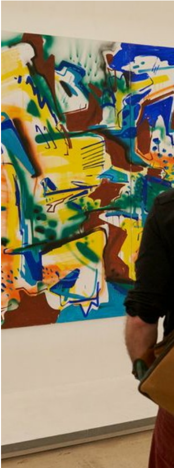
Vernissage de l'exposition "Entre deux" de Mr Post le 13 avril 2024