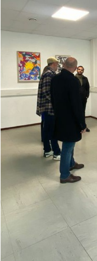
AILO à la galerie du Hérisson